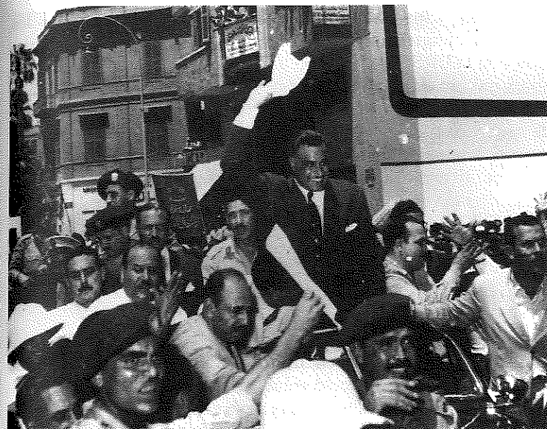
ILUSTRACIÓN XI.1. El presidente Nasser de Egipto es aclamado por multitudes entusiastas en El Cairo, después de proclamar la nacionalización del Canal de Suez

Investigaciones recientes han revelado que hubiera sido fácil evitar la guerra y que Eden estaba más a favor de deshacerse de Nasser por medios pacíficos. De hecho, había un plan anglo-americano secreto ( Omega ) para derrocarlo mediante presiones económicas y políticas. A mediados de octubre de 1956, Eden todavía deseaba que siguieran las pláticas con Egipto. Había cancelado la operación militar y las posibilidades de llegar a un acuerdo sobre el control del Canal de Suez eran buenas. Sin embargo, a Eden lo presionaban por todos lados para que aplicara la fuerza. El MI6 (servicio de inteligencia británico) y algunos miembros del gobierno de su país, incluido Harold Macmillan (ministro de Hacienda),